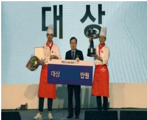
※상기 이미지는 연출사례입니다.