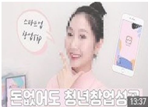
※상기 이미지는 연출사례입니다.